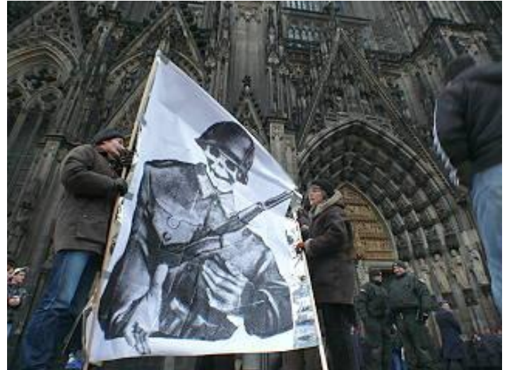
Protest gegen Soldatengottesdienst in Köln 2010

Bis zum Beweis des Gegenteils gehen wir weiter davon aus, dass die mittels Zölibat zur Enthaltensamkeit Verpflichteten einfach aufgrund der verklemmten, scheinheiligen Sexualmoral der Mutter Kirche zu ihren Eskapaden getrieben werden.