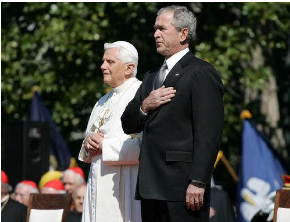
Gemeinsam für „christlich-abendländische Werte“

Der Deutsche Freidenker-Verband protestiert gegen die unverschämte Feststellung von Merkwürden Mixa, wonach die sexuelle Revolution für die Missbrauchsfälle in der katholischen Kirche mitverantwortlich sei. Mixa, der sich als oberster Militärbischof des Landes um die Kampfmoral der Afghanistan-Krieger ebenso sorgt wie um die Geburtenrate der deutschen Mutter, will vermutlich mitteilen, dass die sexuelle Revolution besonders unter seinesgleichen wie eine Bombe eingeschlagen hat.